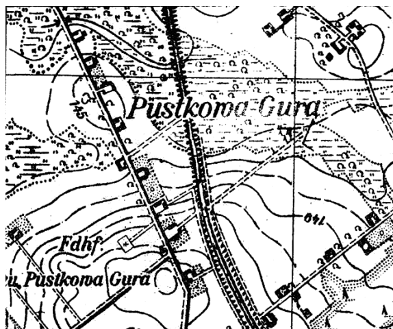
Ryc. 3. Układ przestrzenny Pustkowej Góry z 1944 r. na Mapie Szczegółowej Polski , skala 1:25 000

Fig. 3. The morphological structures village Pustkowa Góra in 1944 on the Mapa Szczegółowa Polski , 1:25 000