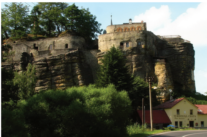
Ryc. 5. Sloup

Jedną z większych atrakcji geoturystycznych stanowi piaskowcowa skała Sloup o wysokości 32 m (ryc. 5). W jej górnej części w XIII w. wzniesiono zamek obronny. Wykute w skałach tunele i sale zapewniały mieszkańcom schronienie. W XVII w. zamek został przebudowany, powstał też barokowy kościół i taras widokowy. Miejscowi pustelnicy przystosowali go do obsługi pielgrzymek.