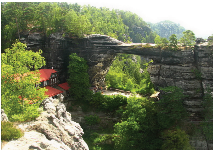
Ryc. 4. Pravčická brána

Region Łabskie Piaskowce leży w północnych Czechach, w obrębie jednostki Góry Połabskie (Děčínská vrchovina), i obejmuje on obszar pomiędzy miastami Hřensko na zachodzie i Chřibská na wschodzie oraz Děčín na południu. Północną granicę, czysto administracyjną, wyznacza granica państwowa z Niemcami. Obszar ten jest częściowo objęty ochroną ustanowionego w 2000 r. Parku Narodowego Czeska Szwajcaria (Národní park České Švýcarsko), do którego od strony południowej, przylega obszar chronionego krajobrazu Łabskie Piaskowce (Chráněná krajinná oblast Labské pískovce). W jego obrębie wyróżnia się następujące formacje skalne: Tiské stěny, Rájec, Ostrov, Děčínský Sněžník, Labské údolí, Hřensko i Pravčická brána, Jetřichovice, Tokáň, Kyjovské údolí, Údolí Kamenice i Srbská Kamenice. Spośród wymienionych form piaskowcowych najbardziej znanym obiektem jest Pravčická brana (ryc. 4).