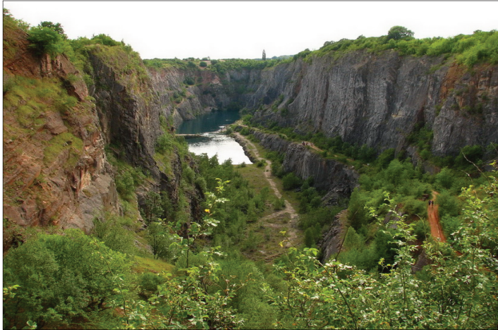
Ryc. 9. Nieczynny kamieniołom „Wielka Ameryka” Fig. 9. Inactive quarry „Big America”

W przypadku Pańskiej Skały (ryc. 10) słupy te są nieco niższe. Ich wysokość wynosi około 12 m (Kühn 2010). Mają również bardzo regularny pięcio- lub sześciokątny przekrój. Unikatowość tych form skalnych sprawiła, że już w XIX w. objęto to stanowisko ochroną. Od 1953 r. obiekt ustanowiono pomnikiem przyrody (Motyčkova i in. 2012).