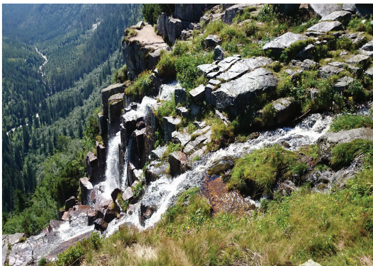
Ryc. 13. Wodospad Panczawski w Karkonoszach

Wodospad Panczawski (Pančavský vodopad) (ryc. 13) jest położony kilkaset metrów na południe od schroniska Labská bouda, na potoku Pančava, który jest pierwszym prawym dopływem Łaby. Jak już wspomniano, jest to najwyższy wodospad w Czechach i składa się z kilku stopni, z których najwyższe osiągają wysokość od 23 do 39 metrów (Janoška 2009).