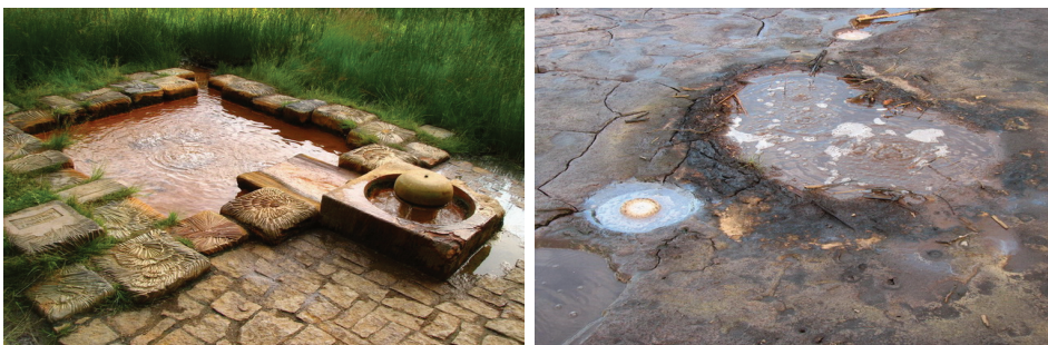
Ryc. 14. Źródło Cesarskie (po lewej) i mofety Soos

Mofety to szczególnie interesujące obiekty geoturystyczne. Można je spotkać w północno-zachodniej części Czech (Karlovarský kraj), w okolicy Franciszkowych Łaźni (Františkovy Lázně). W istniejącym tam rezerwacie przyrody Soos występują liczne źródła mineralne (ryc. 14). Ich liczbę szacuje się na około 200. W części źródeł na powierzchnię, oprócz wody, wydostaje się też dwutlenek węgla. Sam rezerwat, oprócz źródeł, ma jeszcze inne walory geoturystyczne. Zobaczyć tu można tzw. „tarczę okrzemkową”. Powstała ona ze szczątków glonów występujących w przeszłości na dnie bezodpływowego zbiornika. Proces tworzenia się „tarczy” trwał na tyle długo, że osiągnęła ona miąższość około 7 m.