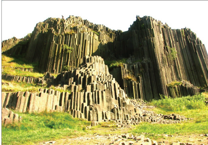
Ryc. 10. Pańska Skała Fig. 10. Panská skála

W przypadku Pańskiej Skały (ryc. 10) słupy te są nieco niższe. Ich wysokość wynosi około 12 m (Kühn 2010). Mają również bardzo regularny pięcio- lub sześciokątny przekrój. Unikatowość tych form skalnych sprawiła, że już w XIX w. objęto to stanowisko ochroną. Od 1953 r. obiekt ustanowiono pomnikiem przyrody (Motyčkova i in. 2012).