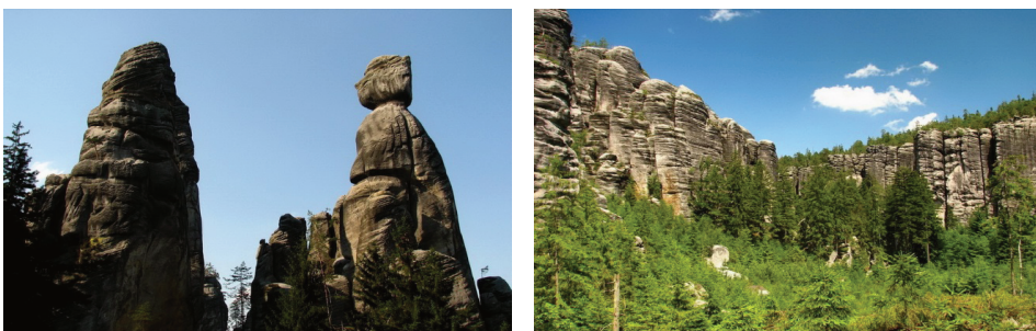
Ryc. 7. Skały piaskowcowe w Adršpachu (po lewej) i Teplicach Fig. 7. Sandstone formations in Adršpach (left) and Teplice

Region Broumovsko należy do najbardziej znanych krain, w których występują skalne miasta. W obrębie tej jednostki znajdują się Čížkovy kameny, Adršpašské skály, Teplické skály, Křížový vrch, Ostaš, Hejda, Broumovské stěny. Obszar Broumovsko w 1956 r. został objęty ochroną jako Obszar Chronionego Krajobrazu Broumovsko o powierzchni 638 ha. Piaskowce występujące w regionie Broumovsko wytworzyły się w obrębie ławic piaskowcowych należących do formacji teplickéj (Migoń 2005). Najczęściej odwiedzane przez turystów skalne miasto tego regionu to Adršpach. Występują tu skalne labirynty, wieże i iglice. Ich wysokość dochodzi do 100 m. Ze względu na swoje kształty noszą one różne nazwy, np. Dzban (Džbán), Głowa Cukru (Homole cukru), Kochankowie (Milenci), Starosta i Starościna (Starosta a Starostová) (ryc. 7).