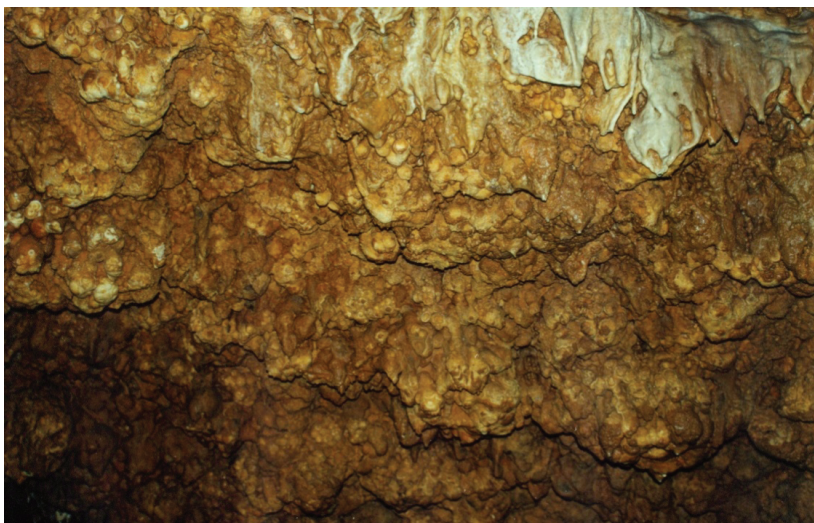
Ryc. 2. Róże konepruskie Fig. 2. Konepruskie roses

Jaskinia Konepruska powstała w wapieniach dewońskich (Czudek 2005). Wzmianki o istnieniu jaskini pojawiły się już w pierwszej połowie XIX w. Po ponownym odkryciu, w 1950 r., znaleziono w niej liczne kości ludzi i zwierząt. Szacuje się, że ludzie zamieszkiwali tę jaskinię już w okresie późnego paleolitu (Komaško 2010). Główną atrakcją jaskini jest jej szata naciekowa oraz ukształtowanie korytarzy. W zagłębieniach spągu korytarzy powstały liczne jeziorka martwicowe, a wśród nacieków uwagę zwracają tzw. róże konepruskie ( Koněpruské růžice ) (ryc. 2). Są to nacieki uważane za najstarsze w jaskini. Ich wiek szacuje się na około 1,5 mln lat. Kształtem przypominają one brukselkę, a ich unikatowość polega na tym, że tworzący je kalcyt poprzewarstwiany jest cienkimi pasemkami opalu (Komaško 2010).