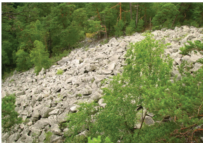
Ryc. 11. Rumowisko skalne Čertova stěna – Luč

Jednym z większych i najbardziej znanych rumowisk skalnych Szumawy jest Čertova stěna – Luč. Znajduje się ono w paśmie Szumawa, pomiędzy miejscowościami Loučovice i Vyšší Brod. Głazowisko tworzą średnio- i drobnoziarniste granity z muskowitem i biotytem. Wysokość rumowiska wynosi 50 m przy nachyleniu 30-40° (ryc. 11).