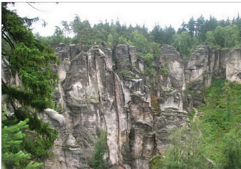
Ryc. 6. Prachowskie Skały. Fig. 6. Prachovské rocks

Czeski Raj (Český ráj) to region położony w obrębie Wyżyny Turnowskiej (Turnovská pahorkatina), należącej do zachodniej części Wyżyny Jiczińskiej (Jičínská pahorkatina). Jest to region zbudowany głównie ze skał osadowych, reprezentowanych przez piaskowce różnej genezy. Płyta piaskowcowa, która powstała w kredzie, a wydzwignięta została w młodszym kenozoiku, wystawiona była na erozyjne działanie licznych potoków. Wśród formacji piaskowcowych wyróżnia się następujące: Mužský, Hruboskalsko, Kozlov, Prachovské skály, Podtrosecká údolí, Plakánek, Apolena, Borecké skály, Kozákov, Sokol, Betlémské a Klokočské skály, Suché skály, Vranovský hřeben, Maloskalská drábovna, Zábrdka. Skupisko skał o najróżniejszych kształtach, a także wytyczenie między nimi szlaków turystycznych podniosło walory turystycznego tego regionu. Największe znaczenie dla ruchu turystycznego posiadają Prachovské skály i Hruboskalsko. Prachovské skály (ryc. 6) składają się z kilku wyodrębnionych bastionów z punktami widokowymi, rozdzielonych obniżeniami dolinnymi, jak Cesarska Droga (Císařská chodba). Jest to odcinek o charakterze gardzieli, otoczony z obu stron ścianami skalnymi o wysokościach dochodzących do 50 m.