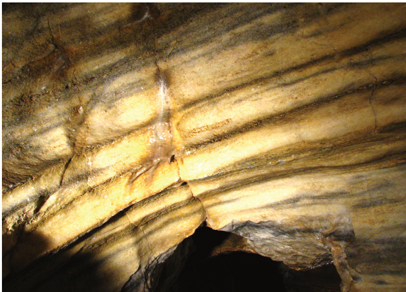
Ryc. 3. Bozkowska Jaskinia Dolomitowa

jeskyni... 2011). W rzeźbie korytarzy jaskiniowych występują, głównie na stropach, charakterystyczne żebra kwarcowe (ryc.3). Dodatkową atrakcją są liczne jeziora krasowe, w tym jedno z największych jezior krasowych w Czechach (Marek, Olszak 2012).