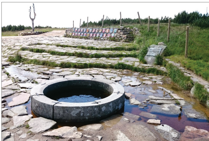
Ryc. 12. Źródło Łaby Fig. 12. Spring of the Elbe

Najciekawszym fragmentem Doliny Łaby w Czechach, jest jej odcinek od miasta Děčín do granicy z Niemcami. Na odcinku tym Łaba tworzy przełom przez piaskowcowe Děčínské Stěny. Odcinek ten, wspólnie z fragmentem Doliny Łaby po stronie niemieckiej, wykorzystywany jest w turystyce wodnej jako szlak transgraniczny. W sąsiedztwie Doliny Łaby występują tu liczne, niewielkie, ale głęboko wcięte dolinki o charakterze kanionów. Przykładem tego może być dolina rzeki Křinice, która wykorzystywana jest do spływów łodziami i tratwami. Rzeka ta jest prawym dopływem Łaby i w dolnym swoim biegu jest rzeką graniczną pomiędzy Republiką Czeską a Niemcami.