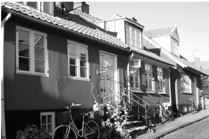
Ryc. 4. Domy na wyspie Christiansø Fig. 4. Homes on the Island Christiansø

W tabeli nr 3 zostały przedstawione propozycje imprez i wydarzeń kulturalnych przygotowanych z myślą o turystach odwiedzających Bornholm w sezonie 2017 w miesiącach od marca do sierpnia. Oferta turystyczna w tym zakresie jest przemysłana, bogata i różnorodna.