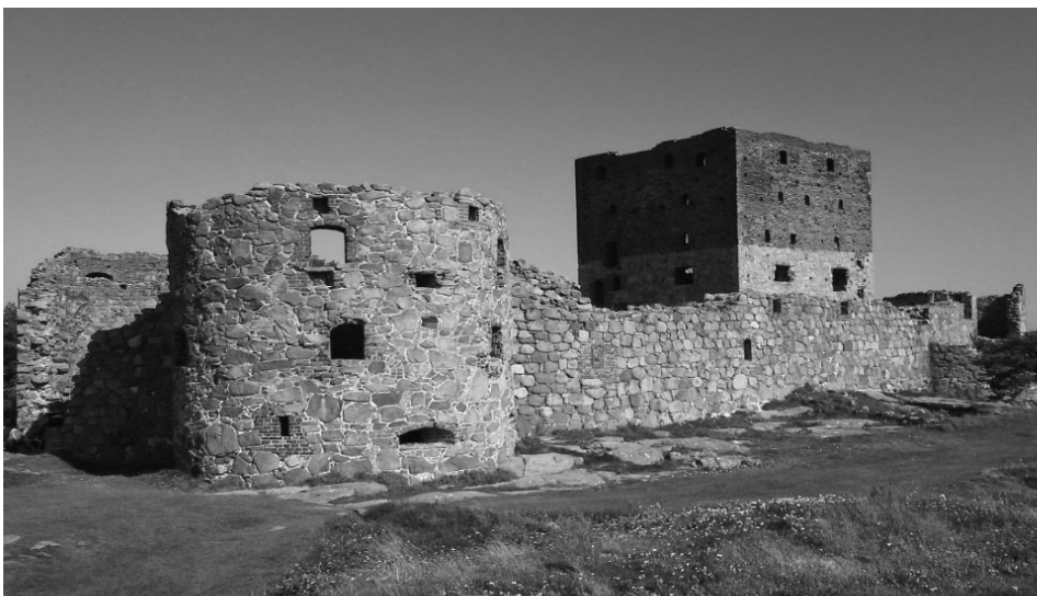
Ryc. 3. Fragment ruin zamku Hammershus.

Wśród krajoznawczych atrakcji antropogenicznych Bornholmu należy wymienić główny symbol wyspy – warownię Hammershus z XIII wieku (ryc. 3), czyli największe w Skandynawii i w północnej Europie ruiny zamku i fortyfikacji średniowiecznych (mur, szańce, wały, fosa, baszta).