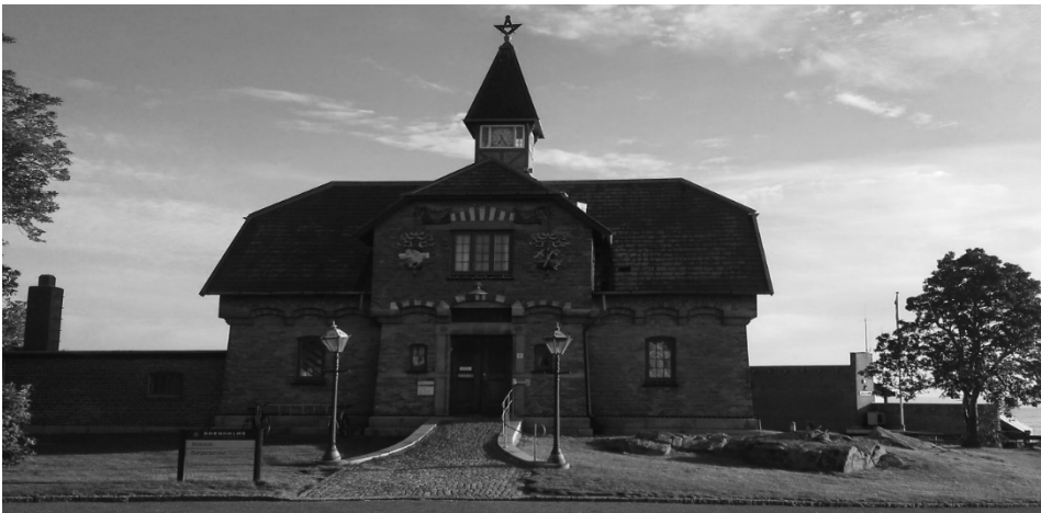
Ryc. 2. Biblioteka w Rønne Fig. 2. Library in Rønne

Wśród walorów krajoznawczych przyrodniczych warto wymienić Święte Skały – Helligdomsklipperne. Są to wysokie do 22 m granitowe formacje skalne tworzące ciekawe formy: szczeliny i grotty (położone na północ od miasta Gudhjem). Kolejną atrakcją przyrodniczą to doliny Dondalen i Kobbeå powstałe przed milionami lat w wyniku pęknięć i erozji skał, mających związek z napięciami skorupy ziemskiej. W obu dolinach są też ciekawe kaskady rzeczne. Wodospad Dondalen ma 25 m wysokości i jest najwyższy w Danii. Kolejny walor przyrodniczy wyspy to Ekkodalen, czyli Dolina Echa o długości 12 km. Jej wysokie granitowe ściany wywołują echo nawet przy cichych dźwiękach. Warto zobaczyć w czasie wycieczki najwyższy szczyt Bornholmu – wzniesienie o nazwie Rytterknaegten (162 m n.p.m.), jeziora polodowcowe – największe to Hammers o długości 650 m, szerokości 150 m i głębokości 13 m oraz najdłuższą rzekę Bornholmu – Øle Å o długości 22 km.