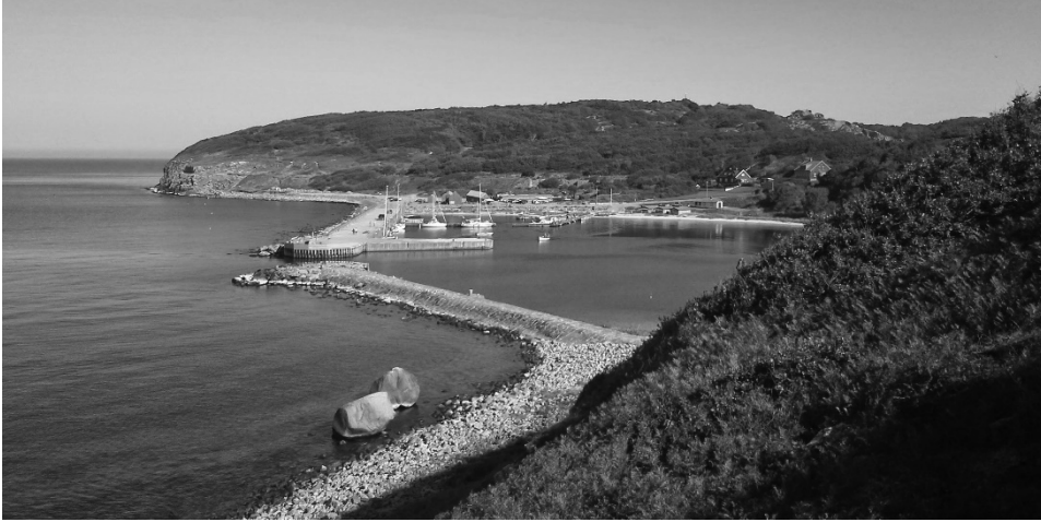
Ryc. 6. Marina pod skałami Hammeren i ruinami zamku Hammershus Fig. 6. Marina under the cliffs of Hammeren and the ruins of Hammershus castle

W Rønne kursują autobusy miejskie nr 21, 22, 23, 23A, 24. Korzystając z nich, można kupić bilet jednodniowy, 5-dniowy, tygodniowy, grupowy (powyżej 15 osób, zniżka 30%) i wielodniowy (10-30% zniżki w zależności od stref). Dzieci (12-15 lat) i osoby starsze (powyżej 65 lat) korzystają ze zniżek w wysokości 50%. Autobusy zabierają rowery za dodatkową opłatą u kierowcy.