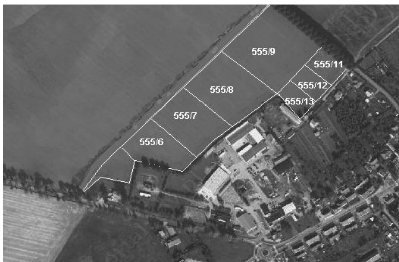
Ryc. 2. Plan Tychowskiej Strefy Inwestycyjnej oraz podstrefy „Tychowo” SSSE Fig. 2. Plan of the Investment Zone and the „Tychowo” subzone of Słupsk Special Economic Zone