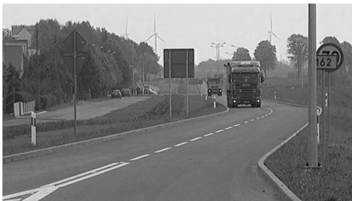
Ryc. 3. Obwodnica Gościna uruchomiona w 2014 roku

Zgodnie z rozporządzeniem Rady Ministrów z dnia 27 lipca 2010 roku Gościno uzyskało status miasta 1 stycznia 2011 roku. W dotychczasowej historii Gościna jako miasta dokonano rozbudowy centrum rekreacyjno-sportowego z zapleczem hotelowym, wybudowano lodowisko, fit park oraz amfiteatr. Zmiany te przyczyniły się z kolei do wzrostu liczby wydarzeń kulturalnych oraz imprez w mieście. Uruchomione zostało także targowisko stałe, supermarket, miała miejsce dalsza przebudowa dróg w mieście oraz budowa ścieżek rowerowych. Podjęte zostały kroki w sprawie budowy obwodnicy Gościna, w celu wyprowadzenia uciążliwego ruchu na obrzeża oraz urbanizacji terenów zachodnich nowo powstałego miasta. Dążenia te zostały uwieńczone sukcesem w 2014 roku, kiedy oddano do użytku odcinek o długości blisko 3 km. Przy nowej obwodnicy (ryc. 3) powstała także stacja paliw (niestety wskutek osiadania gruntu już w roku następnym droga stała się nieprzejezdna i wymagała remontu). Zmiany administracyjne skutkowały też utworzeniem straży miejskiej.