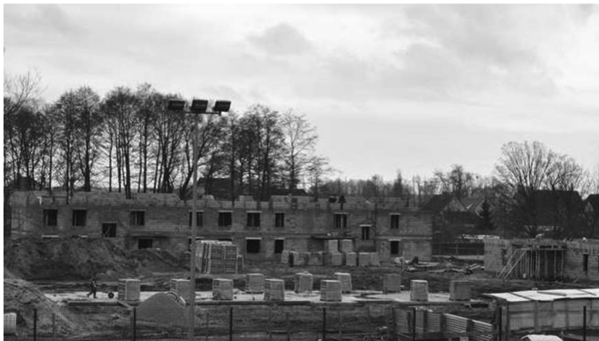
Ryc. 4. Osiedle komunalne w Stepnicy w trakcie budowy w 2013 roku

Zgodnie z rozporządzeniem Rady Ministrów z dnia 30 lipca 2013 roku Stepnica uzyskała statusu miasta 1 stycznia 2014 roku. W latach 2014-2015 przeprowadzono dalsze inwestycje w mieście, powstał supermarket, żłobek, kontynuowano także przebudowę infrastruktury rekreacyjnej i żeglarskiej (etapy IIIa i IIIb). Wyraźne ożywienie nastąpiło w budownictwie mieszkaniowym. W 2014 roku, po raz pierwszy od kilkunastu lat, oddano do użytkowania mieszkania komunalne (łącznie 79), w ramach nowego osiedla (ryc. 4) składającego się z czterech bloków.