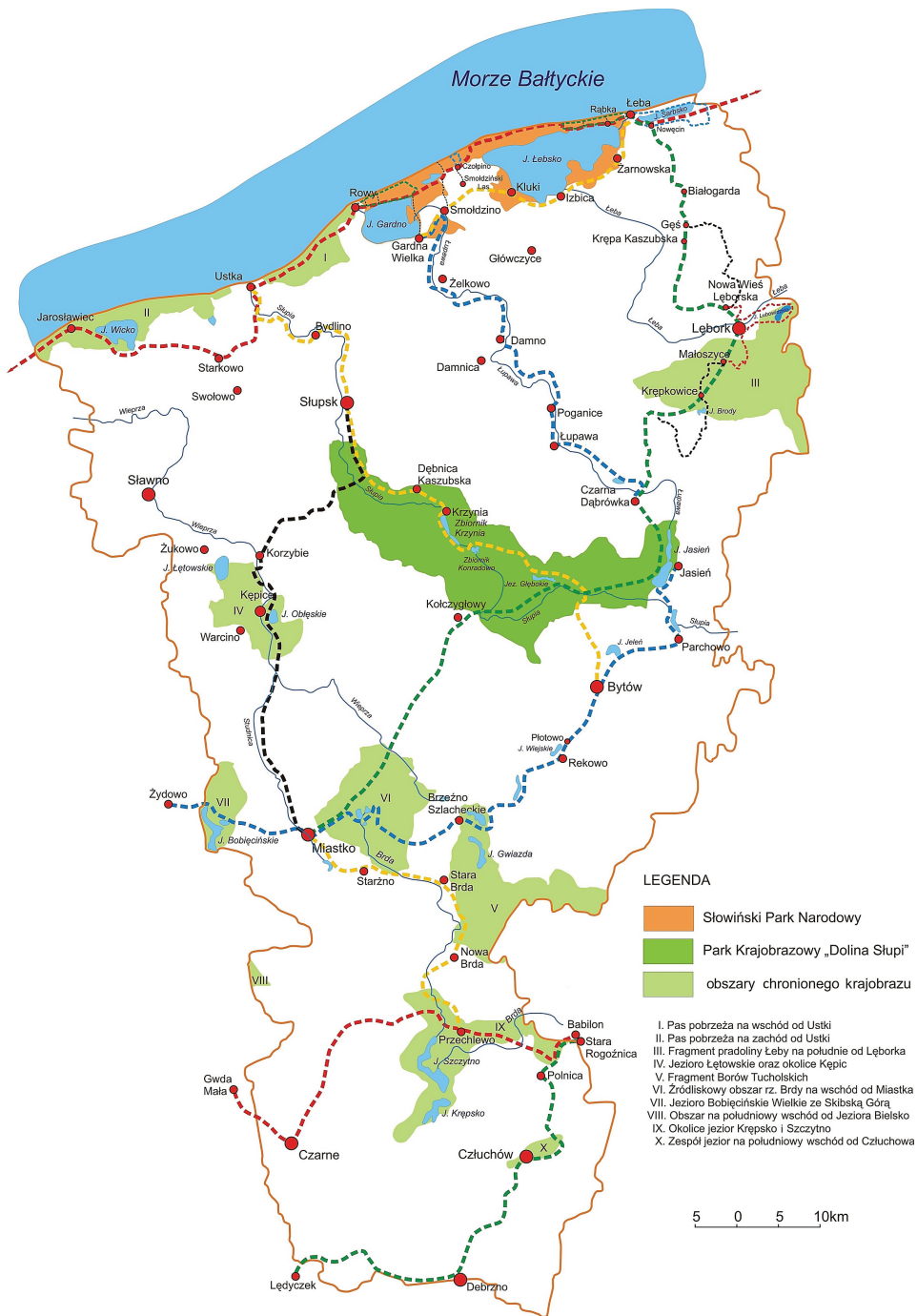
Ryc. 1. Szlaki piesze w regionie słupskim Fig. 1. Hiking trails in the Słupsk region