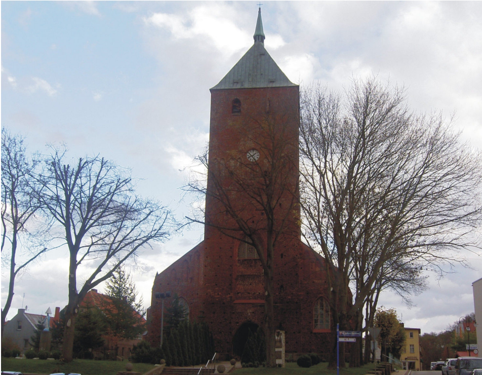
Fot. 3. Kościół parafialny pw. Wniebowzięcia Najświętszej Maryi Panny w Sławnie

Photo 3. Parish Church of the Assumption of the Blessed Virgin Mary in Sławno