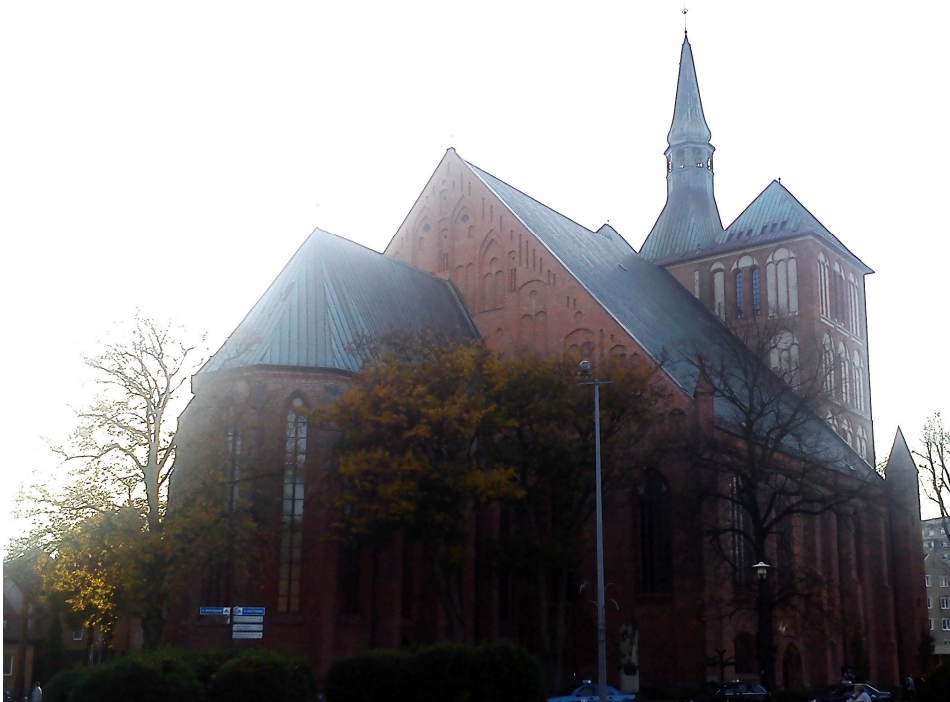
Fot. 1. Konkatedra pw. Wniebowzięcia Najświętszej Maryi Panny w Kołobrzegu

Klasyczny przykład kościoła halowego na Pomorzu Środkowym stanowi konkatedra w Kołobrzegu (fot. 1). Była to pierwotnie ceglana budowla o trzech nawach równej wysokości; dwie skrajne nawy boczne zostały dobudowane w końcu XIV i XV w. Konkatedrę jako ówczesną kolegiatę i kościół parafialny wznoszono od około 1300 r. Wielkość kołobrzegskiego tumu wyraża się nie tylko w jego nazwie budowlanej, ale także w wyposażeniu. Ze względu na liczbę elementów zabytkowych, ich różnorodność i wysoką klasę świątynia ta zajmuje pierwsze miejsce pośród obiektów pomorskich. Jej krzyżowe sklepienie i częściowo ściany ozdobione były wspaniałymi freskami z XIV w. nawiązującymi do włoskiego sposobu malowania i przedstawiającymi sceny ze Starego i Nowego Testamentu. Do najwspanialszych elementów wnętrza kolegiaty należą siedmioramienny świecznik z 1327 r. i brązowa