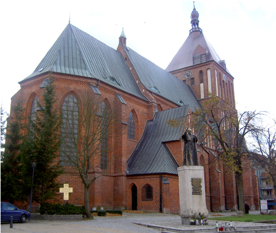
Fot. 2. Katedra pw. Niepokalanego Poczęcia Najświętszej Maryi Panny w Koszalinie

Photo 2. Cathedral of the Immaculate Conception of the Blessed Virgin Mary in Koszalin