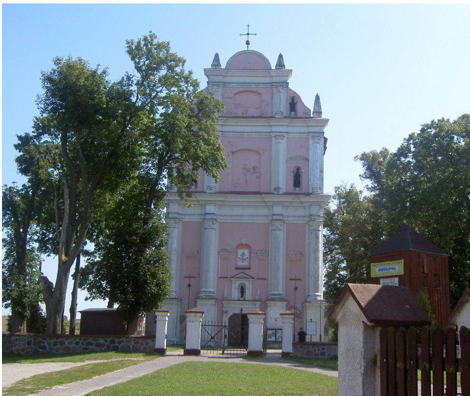
Fot. 5. Kościół parafialny pw. Wniebowzięcia Najświętszej Maryi Panny w Skrzatuszu – Diecezjalne Sanktuarium Matki Bożej Bolesnej Photo 5. Parish Church of the Assumption of the Blessed Virgin Mary in Skrzatusz – Diocesan Shrine of Our Lady of Sorrows

Dla omawianej diecezji najważniejszym kościołem zbudowanym w stylu barokowym jest centrum pielgrzymkowe położone na ziemi wałeckiej, w miejscowości Skrzatusz (fot. 5). Wieś prawdopodobnie pochodzi sprzed 1400 r. Do XVII w. była zamieszkała wyłącznie przez ludność narodowości polskiej. Skrzatusz stał się miejscem pielgrzymkowym od 1575 r., kiedy to do miejscowego kościoła sprowadzono figurkę Matki Bożej słynącej łaskami. Jest to typ tzw. piety radosnej, na której Maryja w momencie największego cierpienia jakby z lekka uśmiechała się czy wyrażała radość z dokonanego właśnie aktu Odkupienia (Jażewicz 2007, s. 120-121). Tenże rozgłos przyczynił się do powstania 1 stycznia 1658 r. samodzielnej placówki duszpasterskiej. W latach 1687-1694 w miejsce pierwotnego drewnianego kościoła z połowy XV w. wybudowano nowy kościół wzorowany na jezuickich świątyniach. Z racji obecności w nim Cudownej Piety plany kościoła uwzględniają jego pielgrzymkowy charakter. Jest to świątynia murowana z cegły, zwrócona ku wschodowi, otynkowana, bezwieżowa, zakończona od wewnątrz kuliście, na zewnątrz wielobocznie. Zewnętrzne ściany zakończone zostały pilastrami, a szczyt zachodni ma dwie kondy-