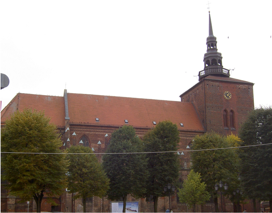
Fot. 4. Kościół parafialny pw. Najświętszej Maryi Panny Królowej Różańca Świętego w Słupsku

Photo 4. Parish Church of the Blessed Virgin Mary Queen of the Holy Rosary in Słupsk