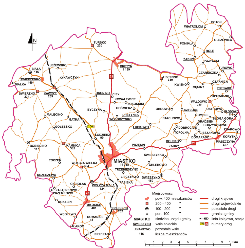
Ryc. 3. Komunikacja i osadnictwo na terenie gminy Miastko

W opisywanej gminie znajduje się wiele miejsc do biwakowania. Wszystkie są ogrodzone, mają urządzenia do odpoczynku oraz wyznaczone stanowiska na palenie ognisk. Położone są nad jeziorami: Byczyńskim, Skapym, Okuninko i Trzcinnu, Bluj w Głodowie, Słosineckim w Słosinku, Głębokim w Świeszynie oraz Wolczyca w Wolczy Wielkiej.